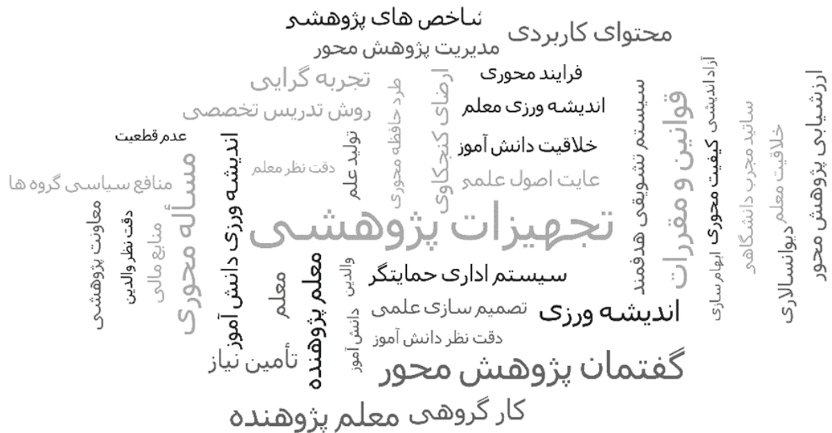
شکل ۱- آبرواژگان سازه مدارس پژوهنده حاصل از تحلیل محتوای مصاحبه ها

سؤال دوم پژوهش در خصوص آبرواژگان مدارس پژوهنده بود. تحلیل محتوای سه سبد تشکیل یافته از الف: ادبیات نظری و پیشینه، ب: تجارت موفق کشورهای جهان و ج: مصاحبه با متخصصان، صاحب نظران و پژوهش گران حوزه تعلیم و تربیت با در نظر گرفتن ۳ ملاک الف: فراوانی تکرار، ب: وزن مفهوم، و ج: قدرت ارتباط با سازه مدارس پژوهنده منتج به تشکیل تصویر زیر گردید. همانطور که در این تصویر مشخص است در ادبیات مربوط به سازه مدارس پژوهنده، سه مفهوم تجهیزات پژوهشی، گفتمان پژوهش محور، و معلم پژوهنده از فراوانی تکرار بیشتر و وزن بالاتر برخوردار بوده و در آبرواژگان مدرسه پژوهنده رتبه بالاتری دارند: