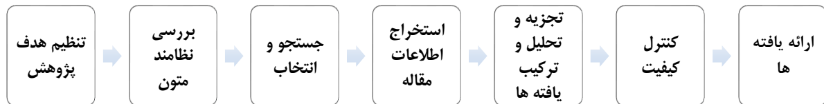
شکل ۱- مراحل هفت‌گانه روش کیفی فراترکیب (Sandelowski & Barroso, 2007)