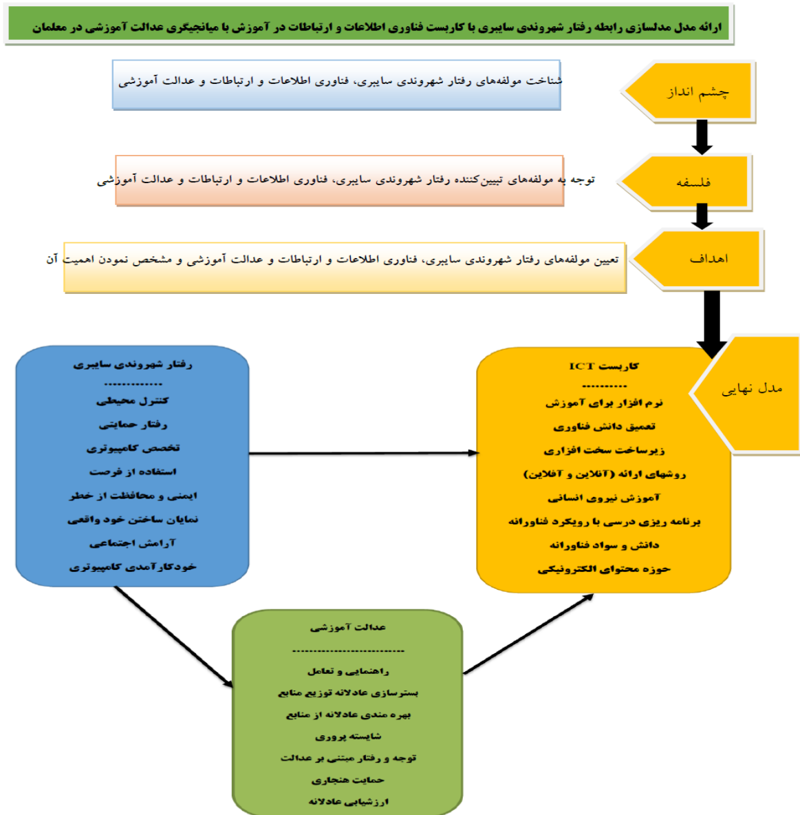
شکل ۳- مدل رابطه رفتار شهروندی سایبری با کاربرد فناوری اطلاعات و ارتباطات در آموزش با میانجیگری عدالت آموزشی

در نهایت با توجه به نتایج حاصله، مدل نهایی بشرح زیر ارائه گردید: