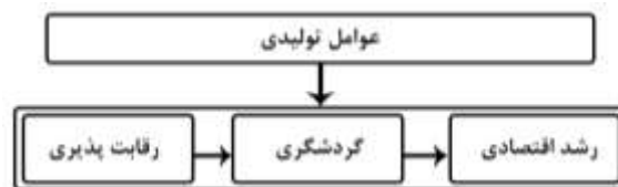
شکل ۱- روابط بین رقابت پذیری، گردشگری و رشد در مطالعات قبلی

شکل ۱ روابط بین رقابت پذیری، گردشگری و رشد را نشان می‌دهد، جایی که رقابت پذیری به گردشگری بستگی دارد، گردشگری رشد ایجاد می‌کند و رشد به عوامل تولیدی بستگی دارد که بر رقابت پذیری گردشگری تأثیر می‌گذارد.